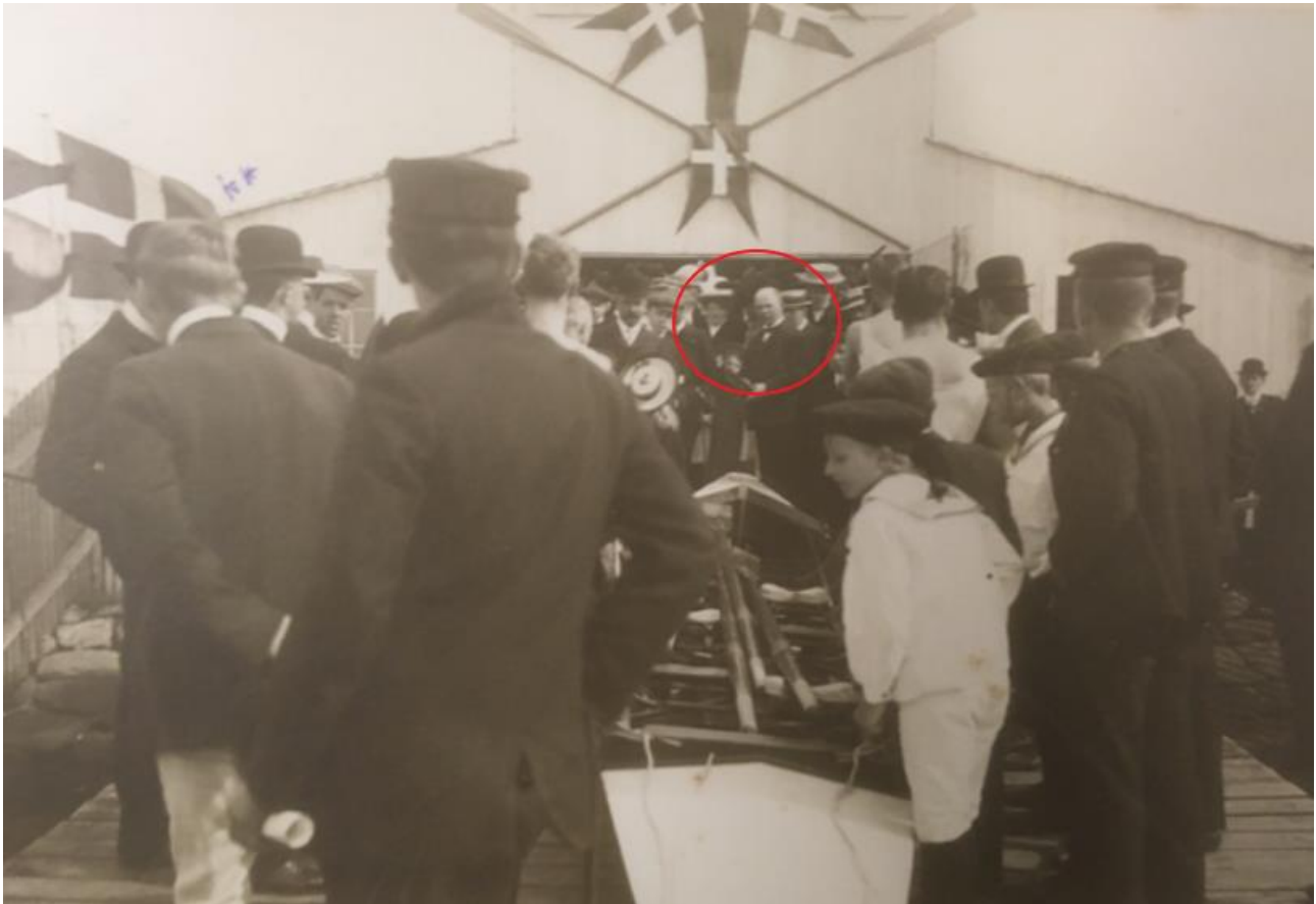
3 Bådedåb 9. maj 1909.