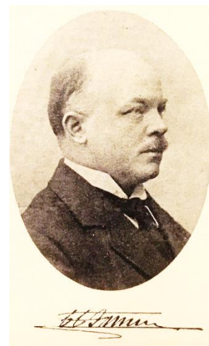
1 Fra Arbejderens 50 års skrift 1920