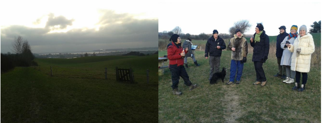
Gåtur i Sundbakkerne 3. jan. 2016