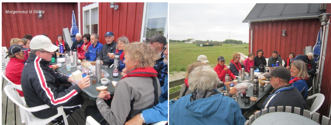
Billeder fra 2013

JA – du læste rigtigt vi mødes kl. 5, vi roer ca. en time og går i land på spidsen af Svelmø til morgenmad sammen med morgensolen og vi får lidt ”ro-vin” til at klare halsen.