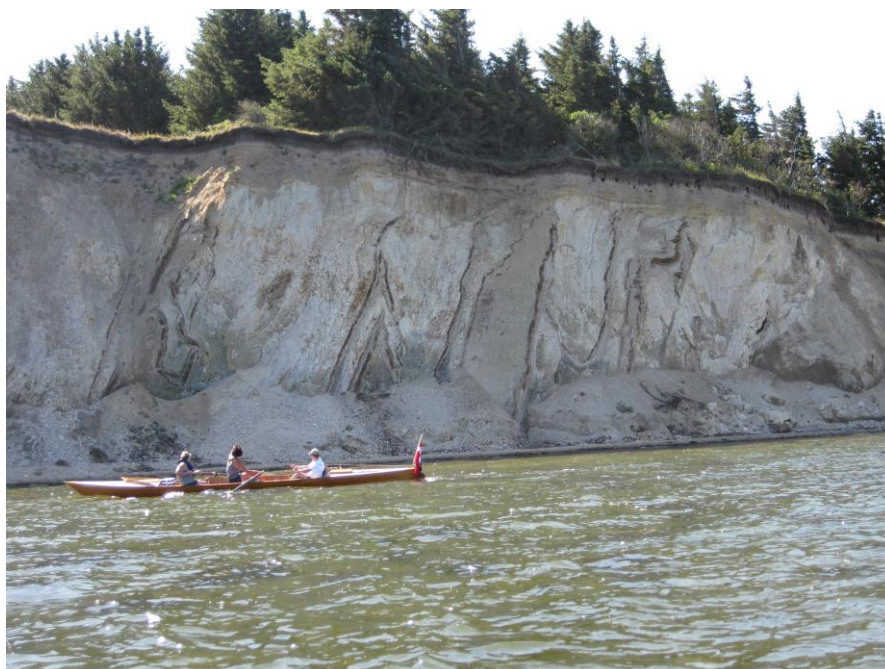
Roere fra Faaborg Roklub på sommerferietur rundt om Fur